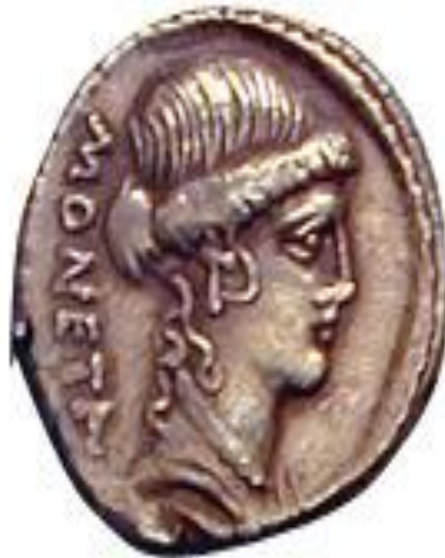
Denar z wizerunkiem Junony Monety